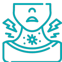
Dor de garganta